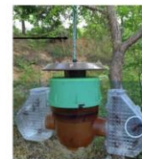
Piège coréen à ailes