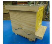
Piège à grilles Néoppi jaunes