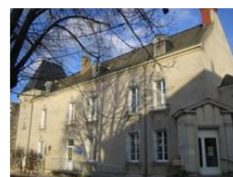
Antenne Information Emploi 2 Place Flandres Dunkerque DOUE LA FONTAINE