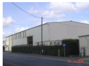
Bâtiment de l'AIE Développement 56 rue Lavoisier - ZI de la Saulaie à DOUE LA FONTAINE