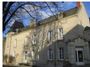
Bâtiment de l'AIE 2 Place Flandres Dunkerque à DOUE LA FONTAINE Tél : 02 41 59 75 18

Ouvert tous les matins du lundi au vendredi de 9 h à 12 h , les professionnels de l'association accueillent, sans rendez-vous , toute personne dans les locaux situés à l'AIE sur Doué la Fontaine.