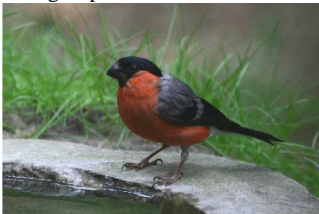
Bouvreuil pivoine, oiseau que l’on ne voit presque plus, victime des pesticides Photo prise aux Thénières