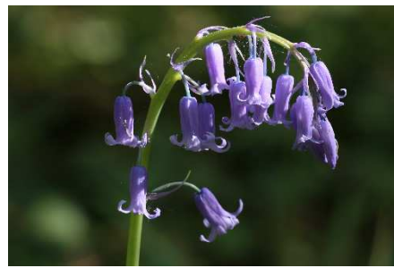
Jacinthe des bois, fleur très courante aux Ulmes Photo prise près de le mare de la Prévenchère